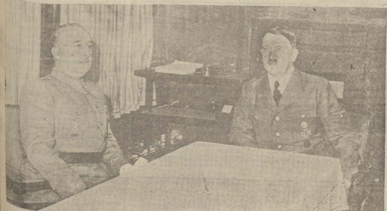
B. Hitlerin general Franko ile mülâkatını tesbit eden ve şehrimize gelen ilk resim

Elenler dün birçok esir aldılar İtalyanlar ağır zayiata uğradılar Epir cephesinde de İtalyanlar geri çekiliyorlar