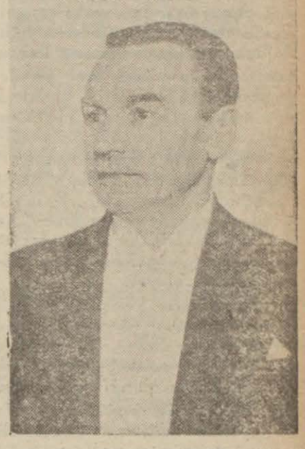
Dahiliye Vekili Faik Öztrak

Hususî surette öğrendiğime göre Ekrem Özdeberi zabıtaya ihbar eden teyzesadesi lise mezunu bir gençtir. Bu uyanık ve vatanperver çocuk Ekrem'in cebinde bir vesile ile muhtelif plânlar bulunduğunu görmüş ve vazifesini yapmakta tereddüd göstermemiştir.